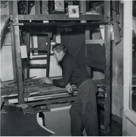
Berthold Bartosch à son banc-titre, circa 1962