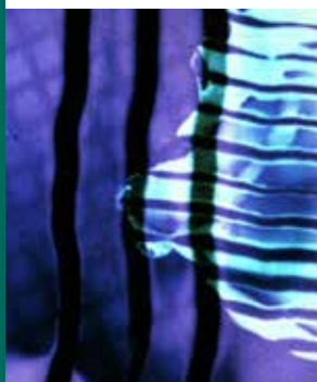
A COLOUR BOX, BFI