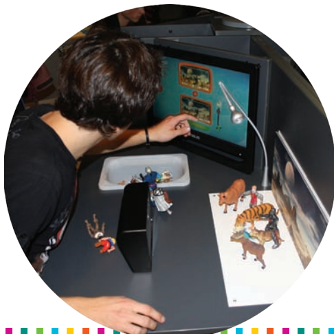
Réalisation d'un film en stop-motion

La scénographie attractive reproduit l'ambiance d'un studio de production grâce à l'univers graphique recréé avec des objets appartenant à l'imaginaire collectif du film d'animation.