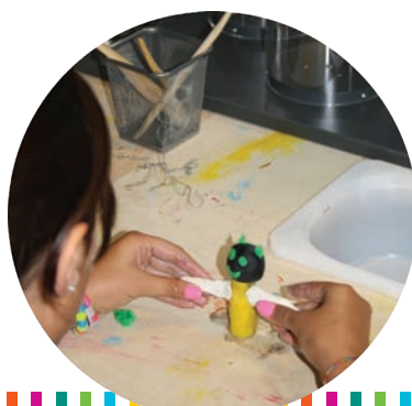
Création de personnages