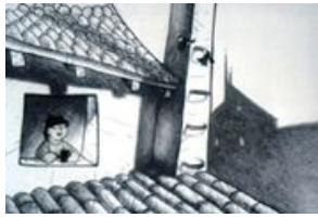
Paroles en l'Air , Sylvain Vincendeau, 2005, 7'