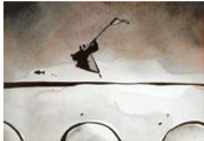
Le Moine et le Poisson , Michaël Dudok, 1994, 7'